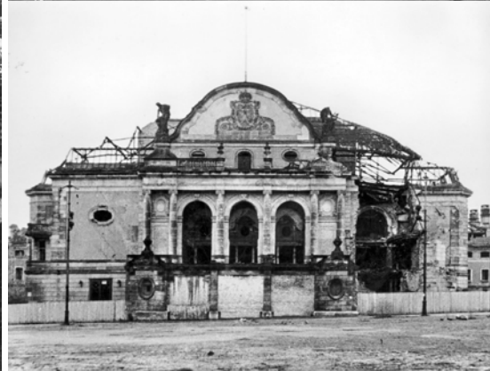
Abb 24-28: Einladung zur Protestversammlung 8.1.1953; Bilder des Staatstheaters um 1951