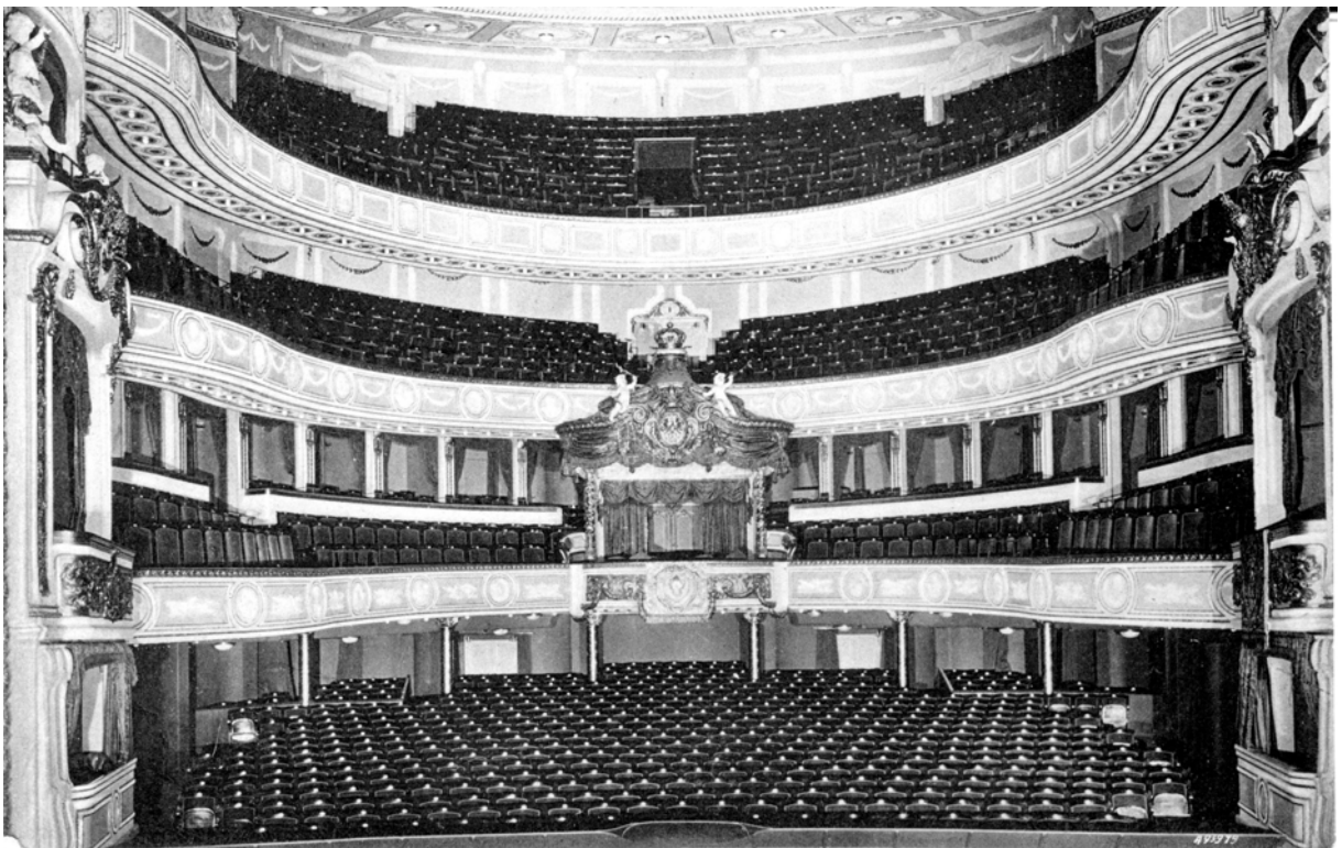
Abb 23 Innenraum des Staatstheaters vor der Zerstörung im 2. Weltkrieg

Im Dezember 1952 erklärte Kallmorgen, dass die Theaterruine aktuell einen Wert von 1,5 Millionen Mark habe. Dies sei aber nur dann der Fall, wenn man den Wiederaufbau im alten Zustand plane. Wollte man aber Veränderungen vornehmen, d.h. eine andere Ausführung wählen, dann habe die Ruine absolut keinen Wert. Zwar befinde sich die Ruine noch in einem rohbauähnlichen Zustand, doch das Bühnenhaus sei weitgehend zerstört. Eine Wiederherstellung des alten Zustandes würde mehr als 7 Millionen Mark kosten, voraussichtlich ca. 11 Mio. Zu den Kosten des Scharoun-Entwurfs bemerkte er, dass ihm die im Raumprogramm festgelegte Bühnengröße von 600 qm zu groß erscheine, also hier vielleicht Kosten einzusparen seien. Eine Abschrift des Gutachtens schickte er an Hans Scharoun, mit der Bemerkung, dass das Gutachten nun hoffentlich die Gemüter beruhigen werde 60 .