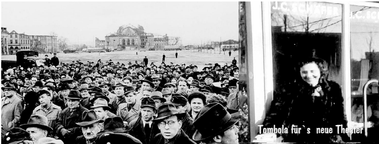
Abb 19 und 20: Losverkäuferin, Tombola 1951 mit wartender Menge, im Hintergrund die Staatstheateruine

Der Wettbewerb stellte die Weichen für Erhalt oder Abriss des alten Staatstheaters. So war die Entscheidung über den gewählten Bauplatz ein wichtiger Punkt der Diskussion. Zunächst einigte sich das Preisgericht auf den alten Bauplatz – also den Platz, an dem damals noch das Theaterhaus von 1909 stand. Bei der Beantwortung der Rückfragen zum Wettbewerb wurde dann aber erklärt, die Anforderungen des Städtebaus seien gleichrangig zum Erhalt des alten Theaters zu werten. Man verhielt sich also zu dieser Zeit in der Frage, ob man das alte Gebäude erhalten oder lieber den offenen Blick in die Landschaft wieder herstellen wollte, noch offen 56 .