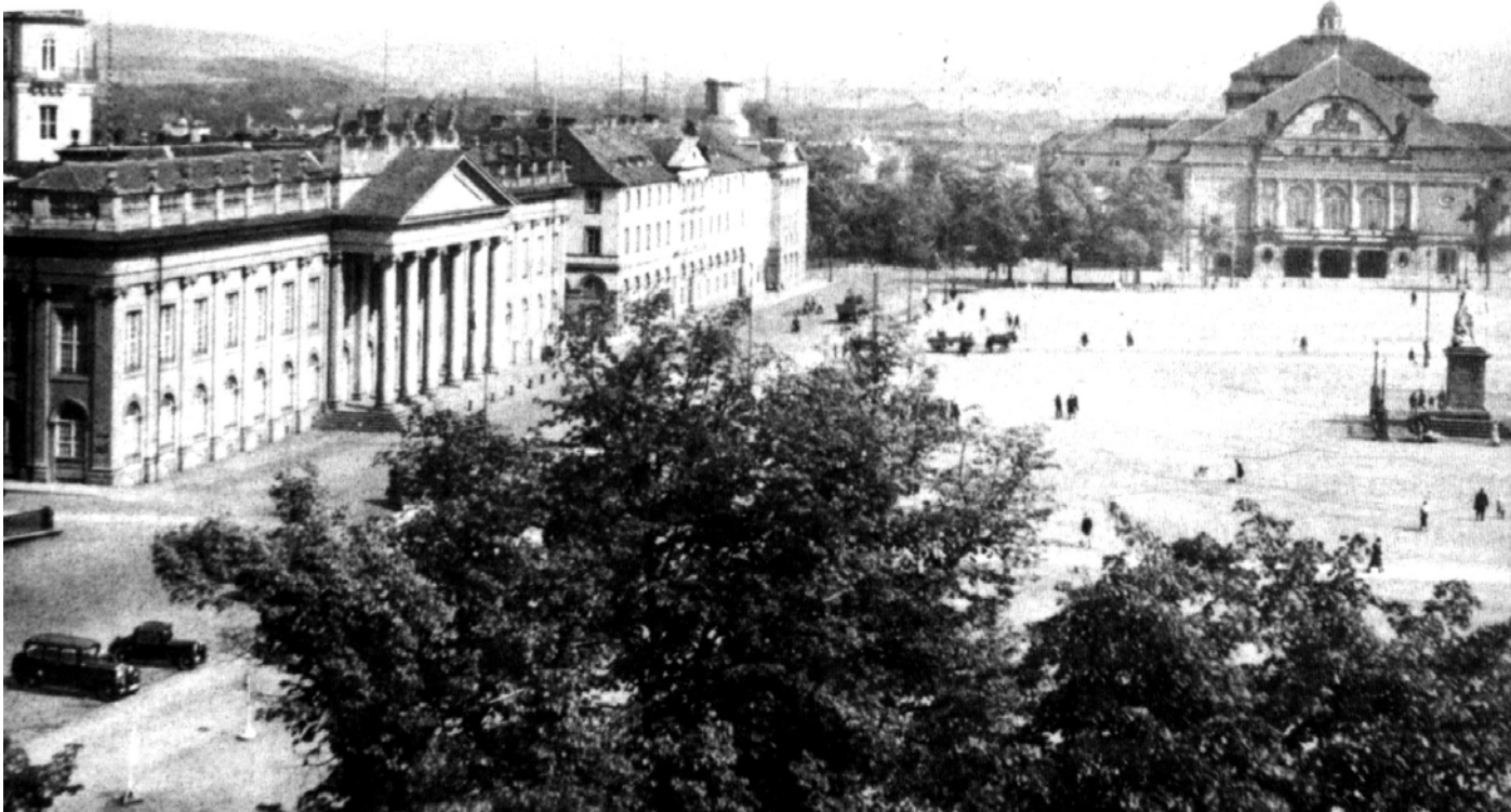
Abb 18: Friedrichsplatz Mit Staatstheater von der Zerstörung 1943

Beim großen Luftangriff auf Kassel am 22.10.1943 wurde das Theatergebäude schwer beschädigt. Über den Grad dieser Beschädigung streitet man bis heute. Auf alten Bildern kann man die Zerstörung des Bühnendaches erkennen. Wie weit die Inneneinrichtung zerstört war, insbesondere die Bühnentechnik, ist unklar, war aber wahrscheinlich nicht unbedeutend. Einige Kasseler berichten, sie hätten kurz nach dem Angriff die Zuschauersitze noch unversehrt vorgefunden. Sicher ist jedoch, dass das Gebäude mit jedem Jahr Leerstand immer weiter verfiel 53 .