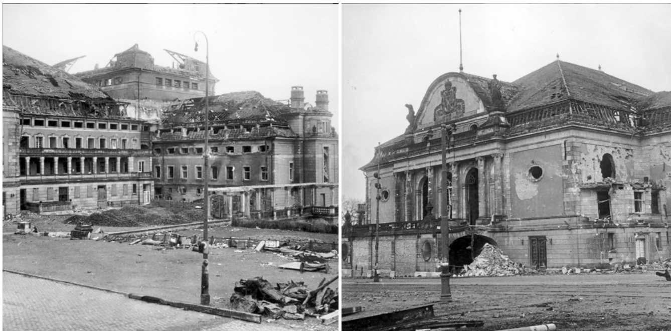
Abb 21 und 22: Ruine des Staatstheaters kurz nach dem 2. Weltkrieg

Der Wettbewerb stellte die Weichen für Erhalt oder Abriss des alten Staatstheaters. So war die Entscheidung über den gewählten Bauplatz ein wichtiger Punkt der Diskussion. Zunächst einigte sich das Preisgericht auf den alten Bauplatz – also den Platz, an dem damals noch das Theaterhaus von 1909 stand. Bei der Beantwortung der Rückfragen zum Wettbewerb wurde dann aber erklärt, die Anforderungen des Städtebaus seien gleichrangig zum Erhalt des alten Theaters zu werten. Man verhielt sich also zu dieser Zeit in der Frage, ob man das alte Gebäude erhalten oder lieber den offenen Blick in die Landschaft wieder herstellen wollte, noch offen 56 .